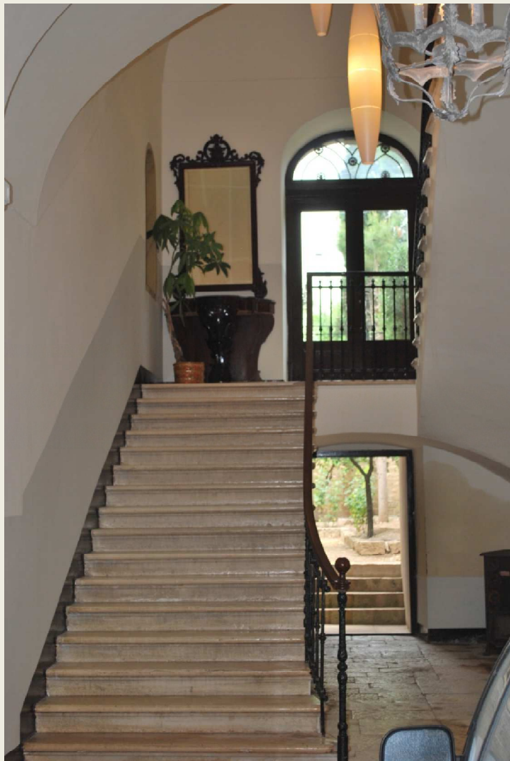
Casa T. – Palo del Colle – rifunzionalizzazione e restauro